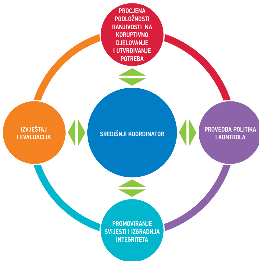
ŠEMA 1. Faze ciklusa izrade plana integriteta

Na šemi 1. prikazani su svi elementi ciklusa integriteta, tj. upravljanja podložnosti/ranjivosti koruptivnim djelovanjima institucije, koji su svi jednako važni, počevši od procjene podložnosti/ranjivosti koruptivnim djelovanjima, koja daje smjernice za druge elemente ciklusa. Konkretno, procjena podložnosti/ranjivosti koruptivnim djelovanjima pruža temelj za uspostavljanje odgovarajućih politika i odabir tehnika